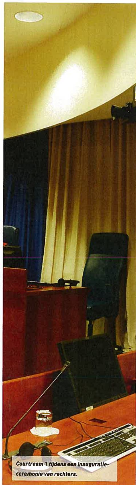
Courtroom 1 tijdens een inauguratieceremonie van rechters.

Na de oprichting van het Joegoslavië-tribunaal in 1993 en het Rwanda-tribunaal in 1994 ontstond langzamerhand wereldwijd de overtuiging dat een permanent strafhof nodig was, in plaats van tijdelijke tribunaal. In 1998 tekenden 120 landen een verdrag tot oprichting van een permanent internationaal strafhof, het Statuut van Rome. In 2002 werd het Internationale Strafhof (International Criminal Court, ICC) opgericht. De taak van het ICC is de berechting van schendingen van internationaal humanitair recht. Het ICC is geen orgaan van de Verenigde Naties, maar een onafhankelijke organisatie, gebaseerd op het Statuut van Rome. Dit werd op 1 juli 2002 van kracht, nadat het was geratificeerd door zestig landen. Inmiddels zijn 111 landen partij bij het Statuut van Rome. Opvallend afwezig daarbij zijn, tot nu toe, de Verenigde Staten van Amerika, net als Rusland en China.