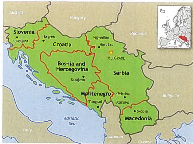
Voormalig Joegoslavië in 1991