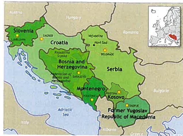
Voormalig Joegoslavië in 2008

Niet alleen het Joegoslavië-tribunaal maar ook het nieuwe internationale strafhof (International Criminal Court, ICC) is gevestigd in Den Haag, in het voormalige KPN-hoofdkantoor aan de Maanweg. Het is de bedoeling dat het in 2014 verhuist naar een nieuw, door Deense architecten ontworpen gebouw op het terrein van de Alexanderkazerne. Behalve het ICTY en het ICC heeft Den Haag nog meer internationale rechterlijke instanties: het Internationale Hof van Justitie en het Permanente Hof van Arbitrage, gevestigd in het Vredespaleis. Bij deze organen van de Verenigde Naties kunnen staten hun onderlinge geschillen beslechten. Daarnaast zijn er in Den Haag een paar belangrijke organisaties die zich met rechtspleging en rechtshandhaving bezighouden: Europol, Eurojust, en de Organisation for the Prohibition of Chemical Weapons (OPCW). Niet voor niets noemt Den Haag zich graag de juridische hoofdstad van de wereld. Deze benaming vindt zijn oorsprong in de woorden van voormalig secretaris-generaal van de Verenigde Naties Boutros Boutros-Ghali, die Den Haag the legal capital of the United Nations noemde.